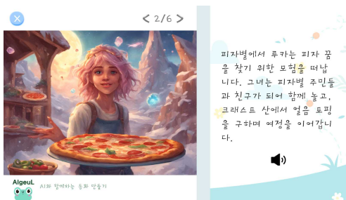
(그림 2) Front-End 동화 재생 화면

Front-End를 구현하기 위해 사용한 언어는 안드로이드스튜디오이다. 어플 레이아웃 디자인은 Figma를 활용하였으며 Back-End와의 연동을 위해서 안드로이드스튜디오의 Retrofit을 활용하였다.