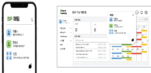
Fig. 4. Store Family Chatting View

각 매장의 홈 화면은 스케줄과 인수인계 등 한 눈에 보기 편한 기능을 위젯 형식(Fig.3)으로 볼 수 있다