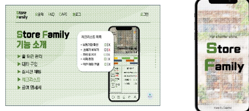
Fig. 1. Store Family Main View