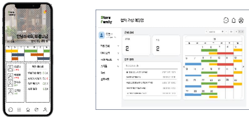
Fig. 3. Store Family Home View

사장과 직원 별로 로그인과 회원가입이 가능하다(Fig. 2). 아이디 찾기와 비밀번호 찾기 기능도 가능하다.