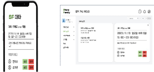
Fig. 6. Store Family Substitute Request Feature admin view

직원은 급한 사정이 생길 경우 대타 요청 페이지를 이용하여 편하게 대타를 요청 게시물을 올릴 수 있으며 다른 직원들은 가능한 날이라면 대타 지원을 할 수 있다(Fig.5)장은 지원한 직원의 명단을 확인하여 승인과 반려를 통해 보다 편하게 대타 직원을 구할 수 있다(Fig.6).