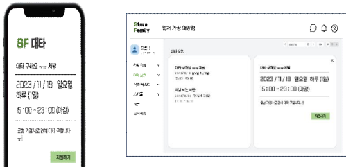
Fig. 5. Store Family Substitute Request Feature employee view

매장 직원과 사장이 원활하게 소통할 수 있도록 실시간 채팅(Fig.4)도 가능하다.