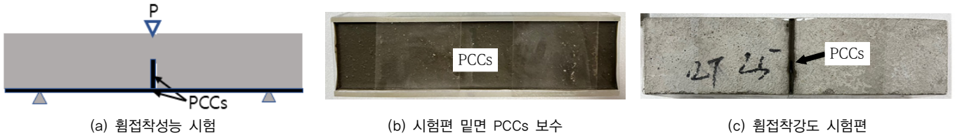
그림 1. 휨접착강도 시험