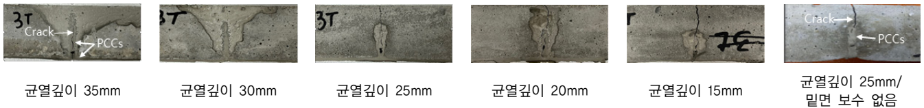
그림 4. 균열두께 3mm의 균열 깊이에 따른 PCCs 보수 단면의 휨접착강도 시험 후 파괴 성상