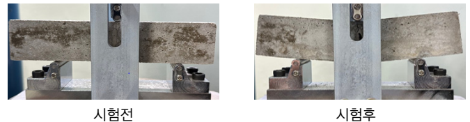
그림 3. PCCs 보수 시험편의 인성개선에 의한 파괴 전 처짐