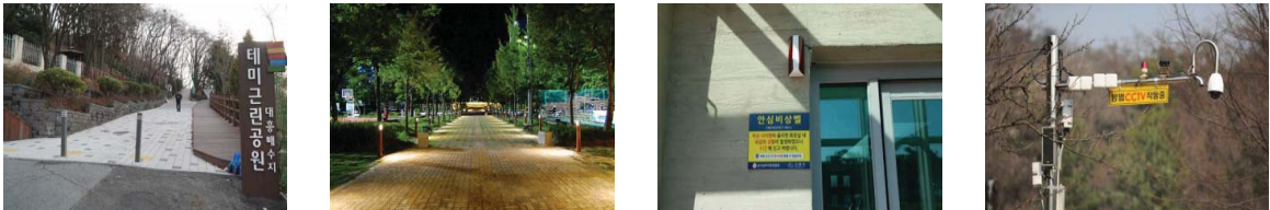
그림 3. 공원·녹지 가이드라인 (차량진입 방지시설, 야간 안전 조명, 비상벨 설치, CCTV 설치)