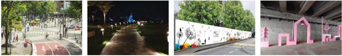
그림 2. 공공가로 가이드라인 (명확한 영역 구분, 조명 계획, 공사가림막 디자인, 교량 하부 디자인)