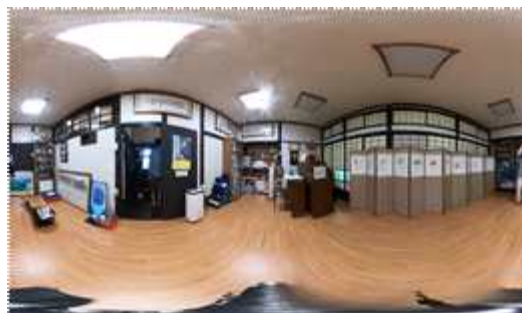
[그림 5] 풀꽃문학관 VR360도 촬영본

이때, 배경음악은 노인 분들의 음역대인, A#2~E4까지인 음역대를 고려하여 노인 분들이 VR을 이용하실 때 한국의 전통 느낌을 실제로 감상하실 수 있게 구현하였다.