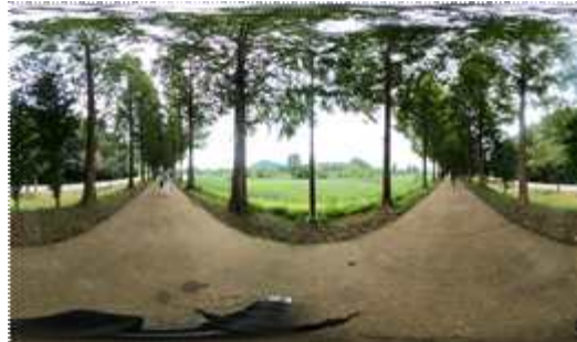
[그림 4] 메타세콰이어길 VR360도 촬영본

이때, 배경음악은 노인 분들의 음역대인, 노인 남성은 A#2 ~ C#3, 노인 여성은 C3~E4의 음역대를 고려하여 노인 분들이 VR을 이용하실 때 아무런 불편함 없이 심리적으로 편안하게 들으실 수 있는 배경음악을 구현하였다.