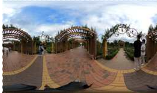
[그림 3] 한밭수목원 VR 360도 촬영본

이때, 자연배경음악은 노인 분들의 음역대인, A#2~E4까지인 음역대를 활용해 배경인, 수목원에 맞게 자연배경음악을 삽입하여 VR을 착용하신 노인분들께서 실제로 한밭수목원에 계신다는 느낌을 받으실 수 있게 구현하였다.