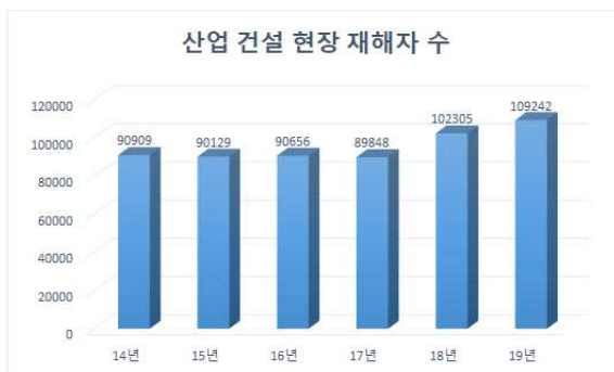
(그림 1) 재해자 수

하지만 현장에선 여전히 안전모 등 안전 조치가 미비한 상태이다. 고용노동부에서 발표한 ‘건설현장 추락 위험 일제점검 결과’에 따르면, 총 3,545개 건설현장의 추락 위험요인을 점검한 결과, 안전조치가 미비하여 시정을 요구한 사업장은 2,448개(69.1%)였다. 이 중 계단 측면의 안전난간 미설치 지적받은 건설현장이 1,665개로 가장 많았고, 근로자 안전모 미착용 등 개인 보호구 관련 지적 현장이 1,156개로 그 뒤를 이었다. 일제 점검을 실시했을 때 2/3이 넘는 건설 현장에서 안전조치 미비 사항이 지적된 것이다[2]. 이 중 지적사항이 30개에 이르는 건설현장도 있는 만큼 작업의 효율성을 안전보다 우선시 하