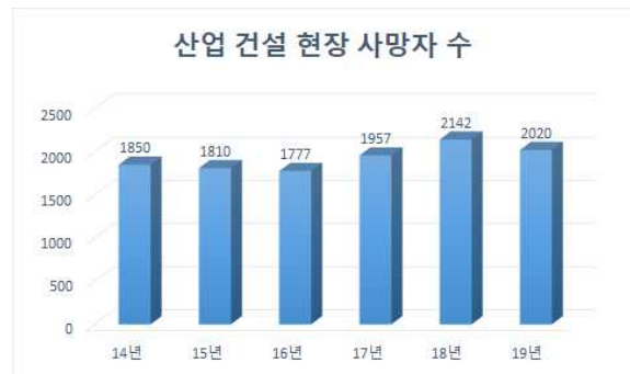
(그림 2) 사망자 수

각종 산업 건설 현장에는 여러 가지 유형의 위험이 도사리고 있다. 2014년부터 2019년까지 산업재해 현황은 매년 평균 95,514명의 재해자가 발생하고 1,926명의 재해 사망자가 발생하였다. 이는 산업 현장에서 평균적으로 매일 261명의 재해자가 발생하며, 이 중 5명의 사망자가 발생하고 있다는 의미이다[1].