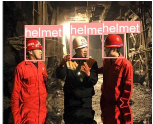
(그림 3) 인식 결과

기다린다. 하지만 사람이 인식 되었는데, 안전모를 착용하지 않았다면 위험한 상황으로 인지하여 알람을 주도록 한다.