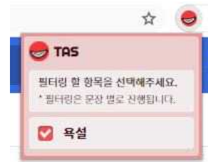
[그림 3] 플러그인 등록 화면

[그림 3]은 본 연구에서 개발한 유해 텍스트 필터링 플러그인 등록 화면이다. 플러그인을 가동하면 서버와의 통신을 통해 웹 페이지에 존재하는 유해 텍스트들이 필터링된다. [그림 4]와 [그림 5]는 각각 동일한 웹페이지에 대한 플러그인 가동 전과 플러그인 가동 후의 화면이다. [그림 5]에서 욕설 포함된 문장이 특정 문장으로 대체된 화면으로 사용자에게 출력된다.