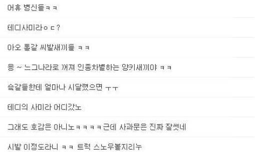
[그림 4] 플러그인 실행 전 웹 페이지