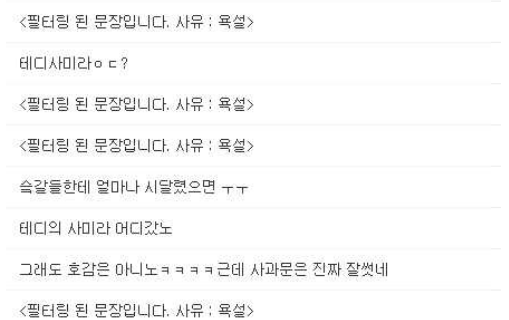
[그림 5] 플러그인 실행 후 웹 페이지