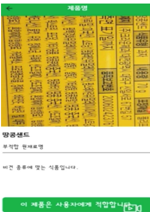
[그림 4] 채식주의자 단계에 적합 시 화면

본 연구는 과학기술정보통신부 및 정보통신기획평가원의 SW중심대학사업의 연구결과로 수행되었음 (2018-0-00209)