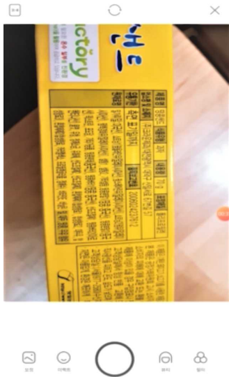
[그림 3] 제품 사진 스캔 화면

향후 연구로는 대체식품 추천 기준과 해당 앱의 실용화 방안에 대한 모색이 필요하다. 현재 대체식품을 추천하는데 있어 제품명을 기준으로 검색하여 대체식품을 추천하고 있지만 제품명을 검색했을 때 결과가 나오지 않는 경우와 제품명 외에 대체식품을 추천할 수 있는 식품의 정보가 검색되지 않는 경우가 있다. 추가적으로 사용자의 알레르기 정보를 입력하여 개인의 다양한 식생활에 적합한 기능을 제공하는 것이 필요하다.