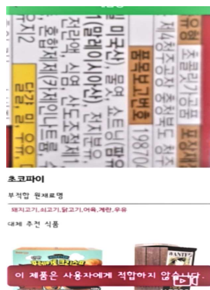
[그림 5] 채식주의자 단계에 부적합 시 화면