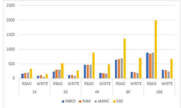
(그림 4) 디스크 IO성능(블록크기: 1K ~ 16K)

기가 증가할수록 그 성능 차이가 급격하게 증가함을 알 수 있다. 따라서, SSD는 응용 프로그램의 읽기/쓰기 비율에 따라 기대할 수 있는 성능은 다소 차이가 있을 것으로 판단된다.