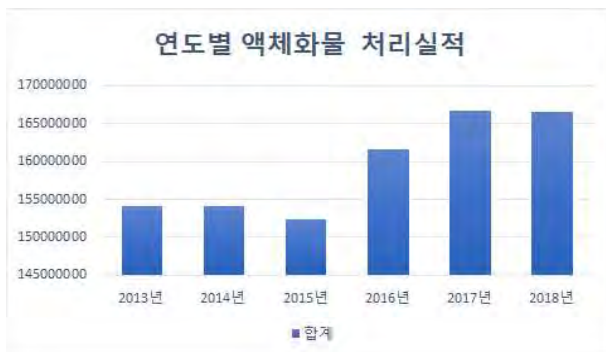
(그림1)울산항 연도별 액체화물 처리실적

항만에서 취급하는 화물 중 액체화물은 매우 큰 비중을 차지하고 있다. 울산항만공사(UPA)의 2019년 통계를 보면 원유 및 석유제품운반선의 비중이 55.7퍼센트, 화물처리 실적에서는 석유류 34.49퍼센트, 원유가 33.23퍼센트로 액체화물의 비율이 67.72퍼센트였으며 그 외 화학제품 13.23퍼센트, 광석류와 차량 부품을 포함하여 19.05퍼센트였다. [1]