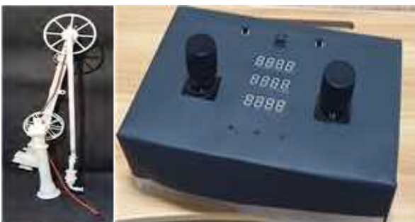
(그림 9)로딩암 mock-up 모형, 로딩암 조종기

그림 9는 시뮬레이션과 연동되는 로딩암 mock-up 모형이다. 시뮬레이션과 mock-up 모형 간의 디지털트윈을 이용하여 발생한 값을 서버로 전송하여 Database에서의 성공 값을 mock-up에 전송해 움직인다. 이는 사고 위험 없는 시뮬레이션을 이용하여 안전사고의 예방이 가능하다. 나아가 디지털트윈 기술 및 5G 실시간 초저지연 통신을 접목해 자동화 및 인공지능화의 기대 가치 또한 크다.