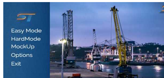
(그림 6) 메인화면 구현

실제 현장에서 작업투입 전 교육에 활용될 수 있도록 구현하였다. 그림 6은 로딩암 시뮬레이션의 메인화면 페이지의 구현이다. 메인화면 페이지에서는 조종사의 로딩암 조종 실력에 따른 난이도를 선택할 수 있도록 구성하였다.