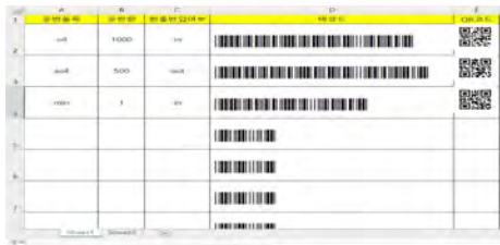
(그림 8) QR코드 구현 화면

이처럼 로딩암이 적재시키는 물류 데이터를 Untact 기술을 이용하여 QR코드로 구현했다. QR코드 데이터를 이용하면 물류 데이터를 보관하기도 용이하고, 대면으로 데이터를 주고받지 않기 때문에 신속성과 편리성을 제공할 수 있다.