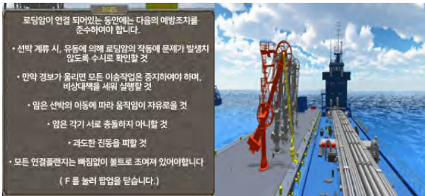
(그림 7) 설명 팝업창과 로딩암 조종 구현 화면

오고 선박은 다시 바다로 출항하게 된다. 이때 Easy Mode는 한 번의 작업으로 끝이 나지만 Hard Mode는 사용자가 다시 한 번 조종할 수 있도록 2번째 배가 들어오게 되고 로딩암 자유 조종을 할 수 있다.