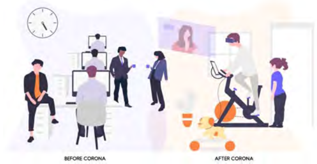
(그림 6. 포스트코로나 관련 광고사진)