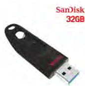
(그림 1. 광고사진)

현재 온라인상에서는 주로 ID/PW와 PIN 인증 방법을 채택하고 있으며 유추 가능성, 개인부주의에 의한 노출 가능성, 일정한 패턴 유추 등의 문제점으로 많은 유출피해와 취약점이 나타나고 있다. 이에