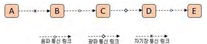
(그림 2) 수중 다중 매체 라우팅의 예

다중 매체 라우팅을 위해서는 여러 매체를 사용하여 통신하기 때문에 전송속도, 통신 대역폭, 전파 지연 등이 모두 상이할 수 있기 때문에 통신 매체간 흐름 제어기능, 프레임 제어 기능, 매체 링크 선택 등의 기능이 추가적으로 필요하다.