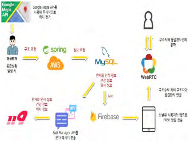
<그림 2> 애플리케이션 작품 구성도