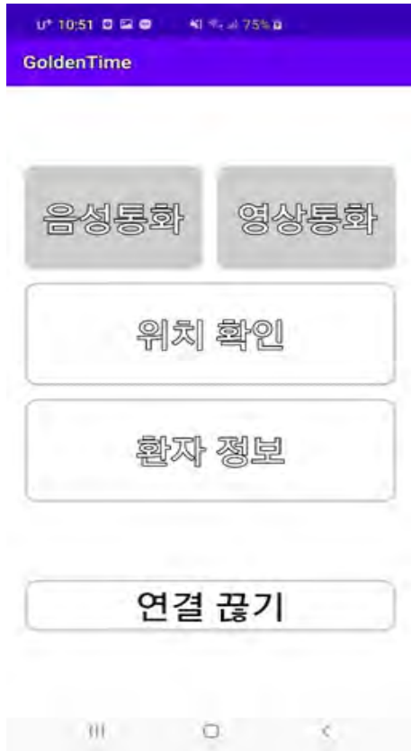
<그림 4> 구조자와 환자 연결 시 화면

(그림 2)는 구조자와 응급환자가 연결되면 응급 구조 시 필요한 기능들을 이용할 수 있는 페이지다. 위치 확인은 구조자와 응급 환자가 서로의 위치를 확인할 수 있는 기능이다.