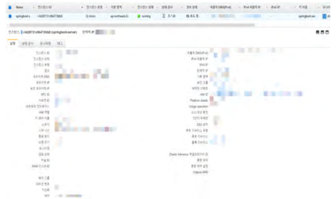
<그림 4> AWS Web Server

본 논문은 AWS(Amazon Web Services)을 사용하여 Linux 기반의 Spring Boot(v2.3.0.RELEASE) Cloud 웹 서버를 구축했다. IntelliJ IDEA 2020.1.1 x64 개발 환경에서 데이터베이스는 MySQL(8.0.20)를 사용했다. 애플리케이션과의 네트워크는 HTTP 통신을 사용했고, 사용자의 디바이스에 알림을 보낼 시에는 FCM(FireBase Cloud Messaging)을 사용했다.