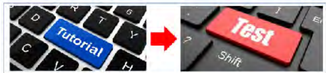
그림 5. Test 알고리즘