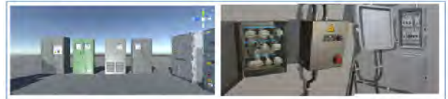
그림 4. Tutorial 알고리즘