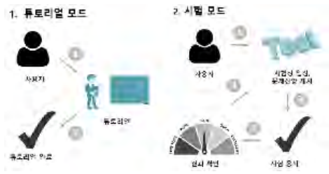
그림 1. 튜토리얼 모드와 시험모드

위의 기능들이 구현되기 위해서는 VR 가상현실 기술, 지능형 기술, 알고리즘 기술들이 요구된다.