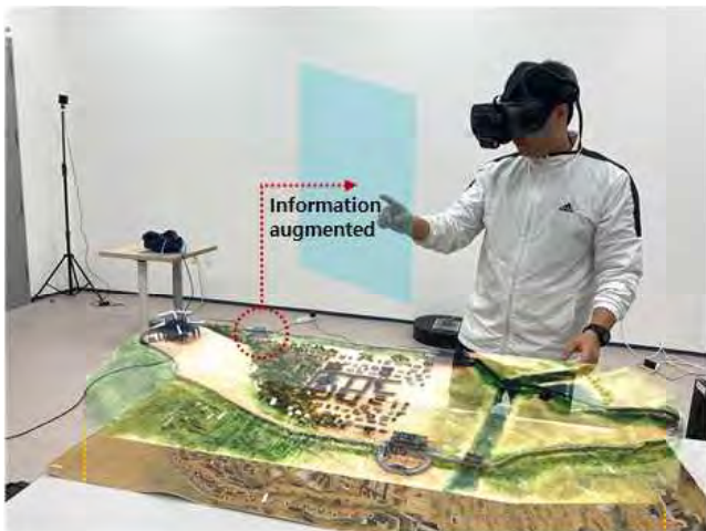
(그림 2) Video see-through HMD를 활용한 지류기반 AR 콘텐츠

지류 기반 MR 콘텐츠는 실물 크기로 컬러 프린팅된 서장대야조도 위에 Video see-through HMD [3]를 사용하여 가상 복원된 건축물과 조경 및 캐릭터를 증강한다. 이를 통해 관람객에게 유물 및 복식, 건축의 상세한 정보제공을 목적으로 한다. Video see-through HMD는 기존 혼합현실 디바이스에 비해 넓은 Field of View (FOV)와 High-poly의 3D model의 구현이 가능하여 관람객의 체험 증대 효과를 기대할 수 있다.