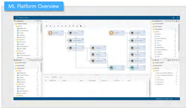
(그림 2) 모형 개발 환경

딥러닝 모형은 각각의 계산 단위로 구성된 블록을 연결하여 개발할 수 있다. 각 계산 블록에서는 저수준 API에서 요구하는 인자(argument)를 입력할 수 있으며 다수의 저수준 API를 하나의 블록에 통합하였다. 모형 개발은 데이터 처리부터 모형 검증 및 배포에 이르기까지 블록의 연결과 실행을 통해 이루어진