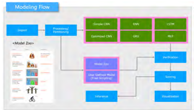
(그림 3) 딥러닝 모형 개발 흐름

다. 개발한 플랫폼에서는 단순한 딥러닝 모형부터 복잡하고 전문적 수준의 모형까지 직관적으로 개발할 수 있다. 이용자들은 ResNet, DenseNet, VGG 등의 사전 학습된 모델을 이용하여 자신의 데이터에 적합하게 전이학습(transfer learning)을 수행할 수 있다 [1]. 플랫폼의 기본 프레임워크는 MXNet과 GLUON으로 이루어졌기 때문에 이용자들이 다른 프레임워크에서 개발한 모형을 본 플랫폼에 적용하기 위해서는 이용자 코드를 적용하고 실행할 수 있어야 한다. 이를 위해 사용자 정의 모델(user defined model)을 호출하고 실행할 수 있도록 하였다.