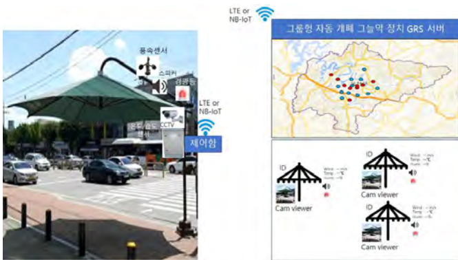
<그림 1> 그룹형 자동 개폐 그늘막 장치의 개념도

전국 252개 시군구가 운영하는 그늘막은 지역별로 차이가 있으나 옥천군의 경우 약 30여 개, 경기도 화성시의 경우 500여 개를 관리하고 있다. 관리자의 애로사항은 태풍이나 갑작스러운 기후변화와 같은 돌발 상황이 발생하면 첫째, 그늘막을 일일이 찾아 접어야 하고, 둘째, 안전사고가 발생하지 않도록 안내방송을 해야 하고, 셋째, 접거나 펼칠 때 사람들이 다치지 않도록 경광등을 켜야 하고, 넷째, 그늘막 손상 사건에 대한 뺑소니를 처리해야 하는 등 어려움을 호소하고 있다.