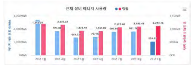
(그림 2) 전체 설비 에너지 사용량 화면

(그림 2)는 실제 공장에 모니터링 시스템을 구축하여 수집하고 있는 공장 총 에너지사용량과 이를 기반으로 제공하고 있는 최대 수요 전력값을 나타내고 있는 화면이다. 이를 통해, 전체 공장의 에너지 사용에 대한 계획과 최대 수요전력에 대한 관리가 가능하도록 정보를 제공할 수 있다. 또한, 설비 세부별로도 에너지 사용량을 제공하고 있어, 각 설비별로도 에너지 관리가 가능하도록 구성되어 있다. (그림 3)은 설비별 전력품질에 대한 모니터링을 나타내고 있는 화면이다.