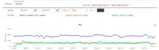
(그림 3) 전력품질 정보 화면

(그림 2)는 실제 공장에 모니터링 시스템을 구축하여 수집하고 있는 공장 총 에너지사용량과 이를 기반으로 제공하고 있는 최대 수요 전력값을 나타내고 있는 화면이다. 이를 통해, 전체 공장의 에너지 사용에 대한 계획과 최대 수요전력에 대한 관리가 가능하도록 정보를 제공할 수 있다. 또한, 설비 세부별로도 에너지 사용량을 제공하고 있어, 각 설비별로도 에너지 관리가 가능하도록 구성되어 있다. (그림 3)은 설비별 전력품질에 대한 모니터링을 나타내고 있는 화면이다.