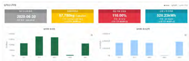
(그림 4) 생산량 연계 에너지 관리 화면

이를 통해, 수량 및 설비에 따른 세부적인 지표정보를 확인함에 따라 공장관리자는 생산에 대한 스케줄링이나 환경설정을 고려하여 공장의 에너지를 관리할 수 있을 것으로 판단된다. (그림 4)는 입력된 제품생산량과 실시간으로 수집되고 있는 설비별 에너지사용량을 활용하여 각 설비에서 생산한 제품과 에너지소비량의 상관관계를 나타내는 화면으로 이를 활용하여, 추가적으로 설비의 생산효율이나 원단위 분석과 같은 제어관리가 가능할 것이다.