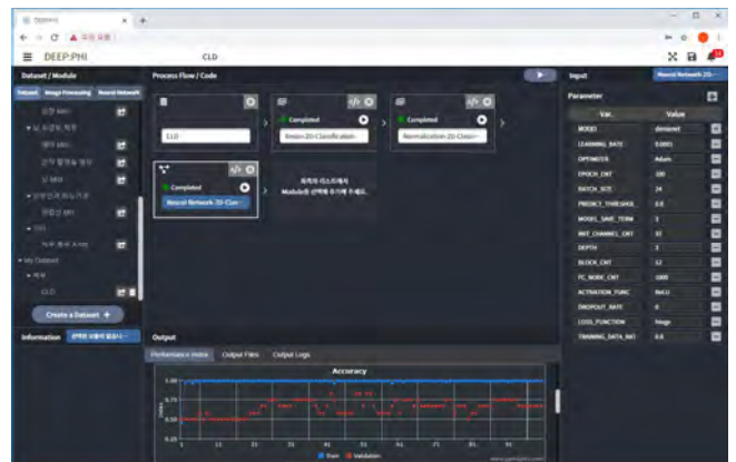
(그림 4) Deep Learning Web 화면 Image processing에서는 2D영상과 3D영상을 지원하는

그림 4는 인공지능을 이용하기 위한 웹 기반 플랫폼의 사용자 화면이다. Web based R_CDM으로부터 다운받은 데이터 셋을 학습용 데이터 셋으로 등록하고 image processing 모듈을 선택하여 기본적으로 제공되는 알고리즘을 사용하거나 CNN, RNN등의 인공지능 알고리즘을 직접 구현하여 Deep Learning이 가능하도록 구성되어 있다.