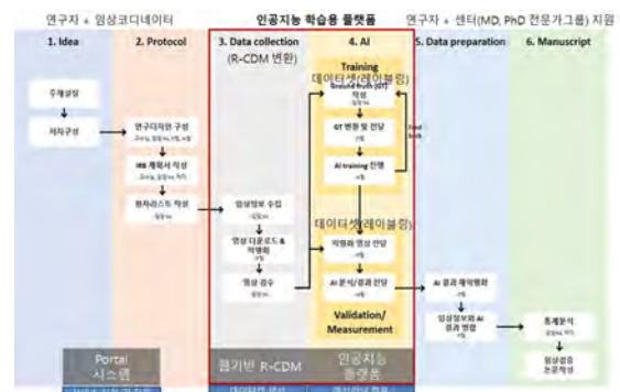
(그림 1) 인공지능 연구 프로세스