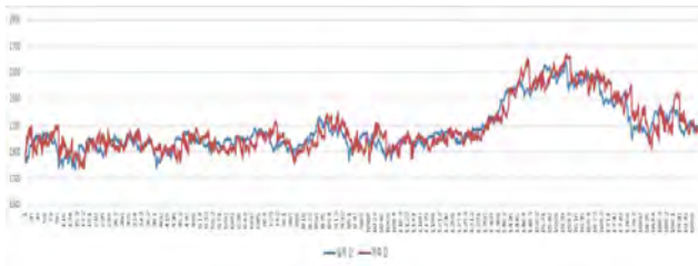
(그림 2) 코스피 예측 가격 그래프.