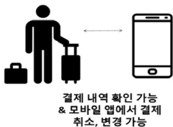
[그림 2] 앱으로 결제 확인, 변경 가능

키오스크를 통해 저장된 블록 정보는 키오스크에 저장되고, 사용자는 결제 직후, 앱으로도 블록에 저장된 해당 데이터 열람이 가능하며 데이터 저장 또한 가능하다. 영수증이 따로 없더라도 모바일에 저장된 데이터를 이용하여 결제 취소, 변경이 가능하다.