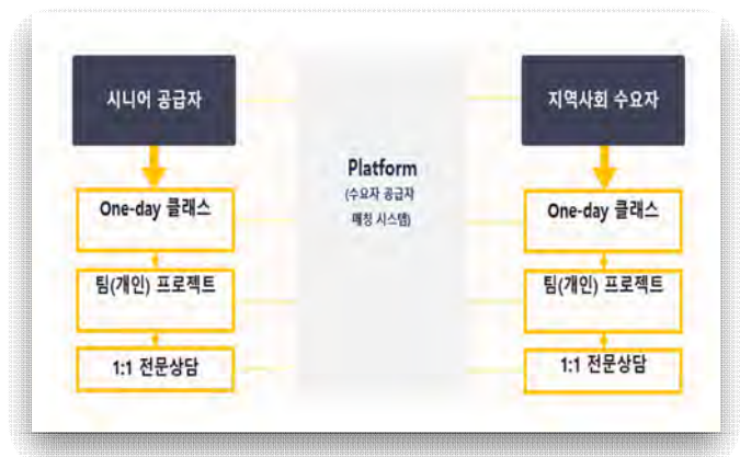
(그림1) 플랫폼 사업 구상도

무엇인가 진지하게 고민하게 되었다. 시니어들이 단순 노무, 단순 직종에만 편중되는 것이 아니라 그들이 가지고 있는 전문지식, 경험을 보다 쉬운 방식, 간편한 플랫폼을 통해 전달할 수 있다면 젊은 층이 효율적으로 일처리를 할 수 있을 것이다. ‘시니어 노