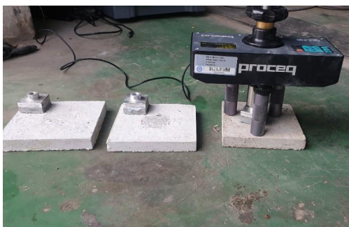
그림 3. 부착강도 테스트