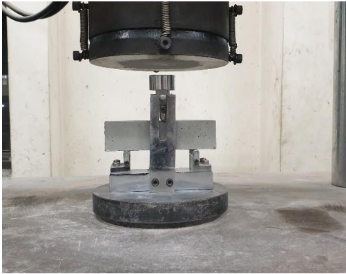
그림 1. 압축, 휨강도 테스트

그림 1은 자기 수평 모르타르의 압축 및 휨강도를 측정하는 기준이며, 그림 2는 폴리머의 혼입률에 따른 압축 및 휨강도의 결과값으로 폴리머의 혼입률이 증가함에 따라 압축강도는 저하되고, 휨강도는 증가하는 것으로 측정되었다. 그림 3은 부착강도를 측정하는 기준이며, 그림 4와 같이 부착강도의 측정값을 확인할 수 있다. 폴리머의 혼입률이 증가함에 따라 부착강도는 증가되는 것으로 측정되었고, 3종류 실험체 모두 KS F 4041에서 규정하는 품질을 확보한 것으로 확인할 수 있다.