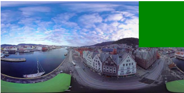
그림 3. 한 타일을 제거한 영상 (AerialCity_3840×1920)

MCTS 를 이용하여 부호화된 영상은 독립적으로 구성된 영상으로 그림 3 을 보면, 4×2 타일로 구성된 영상으로부터 우측 상단의 타일을 제거하였다. 이처럼 타일과 슬라이스가 1:1 로 매칭되어 일부 슬라이스 정보를 제거하더라도 타일 및 슬라이스간 움직임 추정 과정에서 영향이 없으며 복호화가 성공적으로 이루어짐을 확인하였다. 그림 4 는 4×2 로 타일로 구성된 영상들을 분할하고 독립적인 영상들로 추출하여 하나의 영상으로 병합한 결과를 보여준다. 영상은 DrivingInCountry (3840x1920), AerialCity (3840x1920)이며, 그림 4 의 하단 그림은 상단 화면 붉은색 네모로 이루어진 칸을 확대한 그림으로 타일 간의 경계에서 타일 간의 간섭없이 복호화가 매끄럽게 이루어짐을 확인하였다.