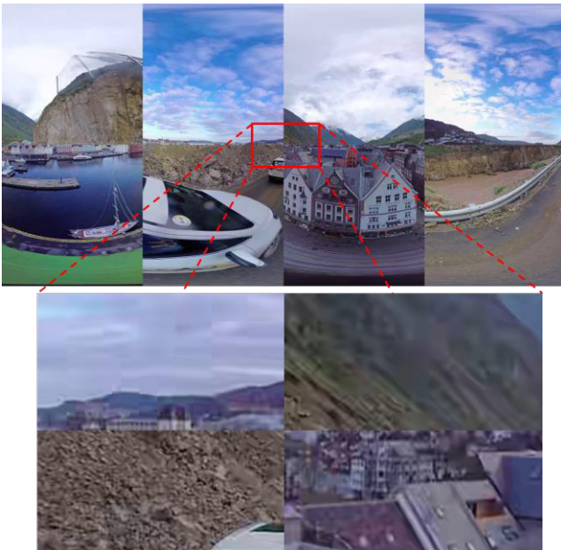
그림 4. 4×2 타일로 병합된 영상 및 경계