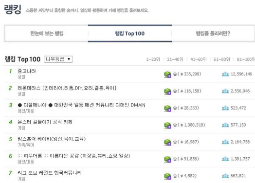
Fig. 1. Naver Cafe Ranking

온라인 커뮤니티 이용은 10대에서도 높은 가입률을 보이고 있는 가운데, 10대 이용자들을 대상으로 온라인 커뮤니티 이용 현황에 대한 연구는 미비하다. 10대 학생들, 특히 고등학생들이 어떤 이유로 혹은 목적으로 온라인 커뮤니티를 이용하고 있는지 살펴볼 필요가 있다. 앞서 언급하였듯이, 남성보다는 여성이 온라인커뮤니티의 평균 접속시간이 길었다는 것을 보았을 때 여자 고등학생들을 대상으로 이용현황을 살펴볼 필요가 있다. 따라서 본 연구에서는 어떻게 이용자가 온라인 커뮤니티의 정보를 해석하는지 확인하고자 한다.