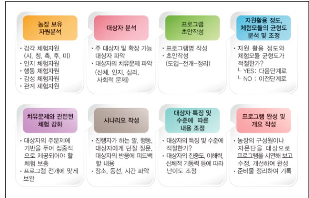
그림 2. 치유프로그램 개발 절차

본 연구는 교육농장을 비롯한 농장에서 치유 프로그램을 개발하기 위한 가이드라인을 제시하고자 하였다. 치유 프로그램을 운영하고자 할 때 각각의 농장의 현황과 자원 특성에 맞는 프로그램을 개발하여 적용할 수 있도록 개발 절차에 초점을 맞추었