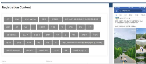
Fig. 3. 사진 등록 웹 페이지 UI

사용자는 파일 첨부 또는 사진 drag를 통해 저장하고자 하는 다수의 사진을 업로드 할 수 있으며, 업로드된 사진은 모든 문자를 데이터로 출력한다. 다음 그림 3은 사진의 추출된 데이터를 나타낸다.