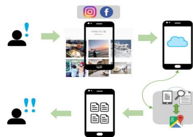
Fig. 1. System Conceptual Diagram

본문에서 제안하는 OCR 기반의 여행 저장 및 공유 시스템은 그림1과 같이 구성되어 있다.