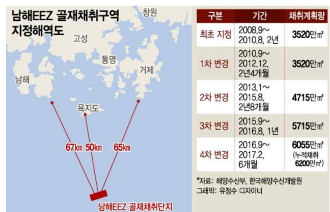
그림 1. 남해 EEZ 모래 채취 계획량

그림 1은 남해 EEZ 모래채취 계획량을 나타낸 것으로 남해 EEZ골재는 2008년 최초 지정된 이래 채취계획량은 계속해서 증가 하였으며 누적 채취량은 2017년 2월 기준 6,200만 3 으로 조사되고 있다. 이처럼 국내에서 공급되는 골재 중 바다모래가 차지하는 비중은 전국적으로 2008년 25.6%에서 2016년 40.8%로 지속적으로 증가하였으며 2017년도의 경우 바다모래 공급비율이 약 25.1%로 다소 감소하였다. 그러나 최근 남해 EEZ골재 채취중단 등에 의하여 2018년도 바다모래 공급계획량은 8.6%로 대폭 감소하는 것으로 조사되고 있다 1) . 특히 남해 EEZ 바다모래 채취 불허 시 골재수급 불안정으로 모래가격이 인상될 것으로 전망되며 이는 연쇄적인 건설비용의 상승을 야기 할 수 있을 것으로 예상된다.