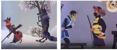
전지 애니메이션 〈사냥꾼을 잡은 여우〉

여우 캐릭터 또한 의인화된 과장된 기법으로 표현하고 있다. 가늘게 뜯은 눈, 얇은 입술은 교활하고 피가 많은 여우의 본색을 드러내주고 있다. 특히 여기서 눈 여겨 볼만한 것은 뒤에서 여우가 사람처럼 직립 보행을 하고 손에 총을 들고 다니는 모습을 표현하기 위해 여우 캐릭터의 비율을 수정하고 관절 부위에 변형 처리를 했다는 점이다.