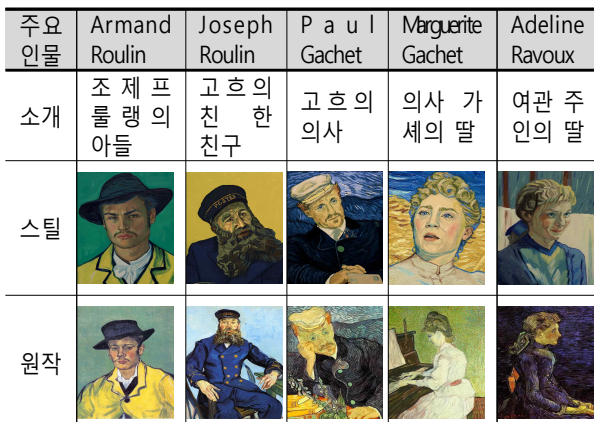
표 2. 주요 인물과 고흐의 작품의 대응 관계

그의 작품 속에 나타난 사실 세계를 복원하여 관중들에게 재현하였다. 이 작품은 <밤의 별>에서 시작하여 파리 오르세미술관의 <로나의 밤의 별>에서 끝나며, 엔딩장면은 <까마귀가 밀밭>이라는 작품을 근거하여 고흐의 자살 장면이 연출된다. 이 장면은 정수리의 배경의 옷 무늬를 혼합시키며 작품은 끝이 난다. 이 작품들은 후기인상주의의 주된 특징인 인간의 내면과 감정을 큰 면적에 밝은 색을 이용하여 잘 표현하고 있다.