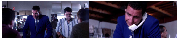
▶▶ 그림 1. 주인공에게 스트레스를 주는 전화

주인공은 자라온 환경으로 인해 자신의 심리를 제대로 표현할 줄 모르는 인물이다. 특별히 영화의 초반부에서는 주인공의 소심한 면이 더욱 부각되고 있어서 주인공의 심리는 인물을 통해 표현되지 않고 라이트모티브를 활용한 음악으로 표현한다.