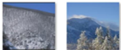
(b) 비화재 상황을 화재 상황으로 감지