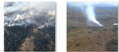
(a) 화재 상황을 비화재 상황으로 감지