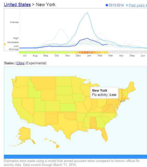
Fig.2 . Google Flu Trends[2]

미디어 콘텐츠 유통기업인 넷플릭스(Netflix)는 이용자의 영화 대여 목록에 기초해서 새로운 영화를 추천해주는 시네매치(Cinematch) 시스템을 개발했다. 넷플릭스는 시네매치 시스템의 정확도를 높이기 위해 상금을 걸고 경진대회를 열기도 한다. 넷플릭스의 빅데이터 경영은 경쟁기업인 블록버스터(Blockbuster)를 파산에 이르게 한 동인으로 평가하고 있다.