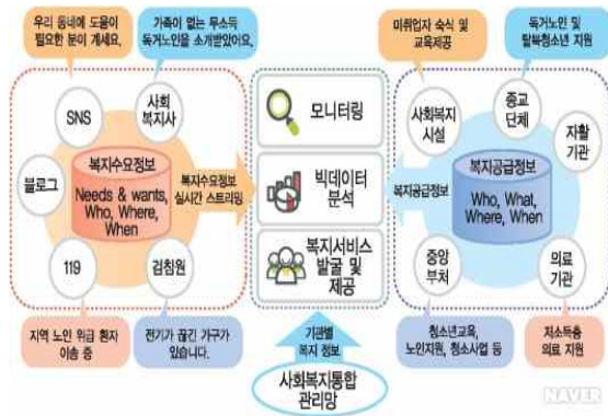
Fig. 3. Social welfare integration management network