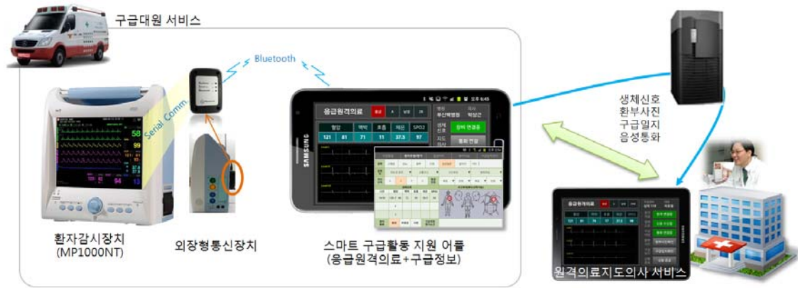
Fig. 1 The Structure of Environment for Smart Emergency Information Service.