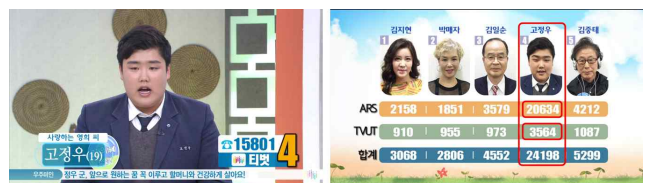
[그림4] 전국이야기대회 ‘내말 좀 들어봐’

매주 수요일 전국이야기대회 ‘내말 좀 들어봐’에서는 5명의 일반 시청자가 출연하여 그들의 삶의 애환이 담긴 인생이야기를 털어놓는다. 실시간으로 티벳을 통해 시청자들의 투표수로 1등과 2등을 결정하며, 이들에게는 각각 100만원, 70만원의 상금을 지급한다. 일반 시청자들의 삶의 애환을 통해서 웃음과 감동을 선사하기 때문에 시청자 참여율이 높은 코너이다.