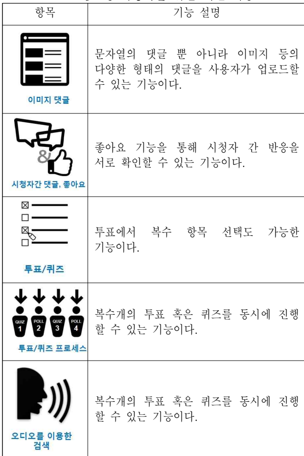
[표2] 시청자를 위한 개선 기능

제작자, 사용자들의 요구에 의해 추가된 기능들에서 보듯이, 제작자들은 스튜디오 모드, 실시간 표출, 외부 그래픽틀 활용 등 다양한 형식의 프로그램에서 활용할 수 있는 시청자 참여 서비스 플랫폼 기능을 요구하고 있고, 사용자는 이미지 댓글, 동시/다중 참여, 오디오를 이용한 검색 등 다양하고 편리한 방법으로 참여할 수 있는 방안을 요구하고 있다.