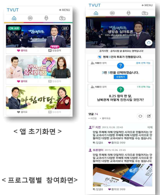
[그림2] 티벳2.0 앱 사용자UI

프로그램별 참여화면은 크게 세 부분으로 구성된다. 상단에는 프로그램 메인 이미지와 홈페이지 링크가 존재한다. 중간 영역은 티벳 투표 영역이다. 제작자의 시청자 참여 매니저로부터 실시간으로 제어되는 투표 혹은 퀴즈가 진행된다. 하단은 댓글 영역이다. 티벳을 이용하는 다양한 연령대의 시청자와 함께 프로그램과 관련된 댓글을 공유하는 영역으로 이미지 첨부가 가능하다. 또한, 시청자들간의 소통을 위해 댓글에 대한 답글과 '좋아요' 버튼 클릭 기능도 제공한다.