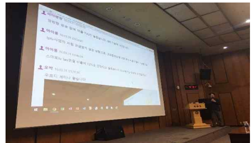
[그림8] KBS 사내 세미나 적용