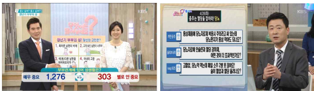
[그림6] 무엇이든 물어보세요 시청자 참여형태

두 번째는 [그림6-우]처럼 실시간 시청자 질문을 받는 형태가 있다. 의대교수를 초빙하여 당뇨병에 관한 시청자들의 궁금증을 실시간으로 받아 해결해주는 방식으로 진행된다.