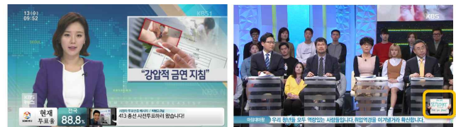
[그림7] 특집 프로그램 적용

[그림7-우]처럼 또 다른 특집프로그램 '일자리가 미래다' 에서는 일자리를 찾는 젊은 청년들을 응원하는 시청자들의 이미지 댓글을 방송에 활용하였다.