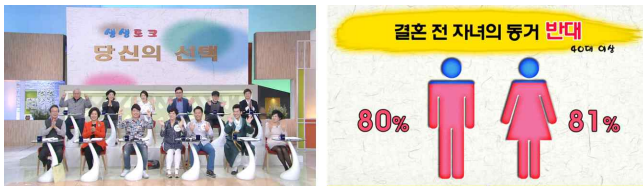
[그림5] 전국이야기대회 '내말 좀 들어봐'

성향을 일부분이나마 확인 할수 있다. 이렇게 시청자들의 방송 참여 통계를 활용한 아침마당 금요일 프로그램 생생토크는 2016 휴스턴 국제 필립페스티벌에서 금상을 수상했다.