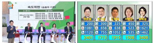
[그림3] 서바이벌토크쇼 ‘고급정보 열전’

[그림3]과 같이 매주 월요일 서바이벌 토크쇼 ‘고급정보 열전’에서는 ‘의학, 법률, 예술, 미용, 피트니스’ 등 각 분야의 전문가 5명의 정보요원이 나와 시청자에게 필요한 고급 정보들을 소개한다. 이들 정보요원이 소개한 정보의 유용성을 티벳을 통한 시청자 투표로 점수를 부여한다. 3주 단위로 정보요원이 받은 점수를 합산하여 정보 요원의 탈락 및 교체를 결정하게 된다. 이것이 서바이벌 토크쇼라고 부르는 이유이다.