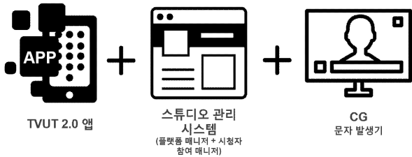
[그림1] 티벳 플랫폼 구성요소

요구사항을 반영하여 2.0 버전이 개발되었다. 플랫폼은 특정 목적을 위해 다양한 기능들을 보편적으로 제공하는 기반 혹은 틀을 의미한다. 따라서, 플랫폼으로서 티벳 2.0의 개발 결과의 핵심은 손쉬운 시청자 참여 서비스 적용 프로그램 확대가 가능하다는 점이다. 이러한 티벳 플랫폼은 [그림 1]와 같이 3가지 요소로 구성된다.