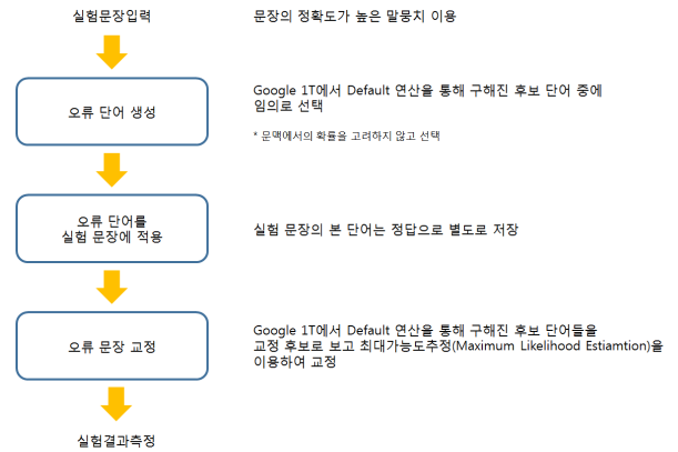
그림 2 교정 순서

기존의 단어 생성 및 교정 후보는 예로 'had'라는 단어가 있을 시에 키보드 환경을 고려하며 혼동 집합을 미리 만들고 교정 대상 단어와의 편집거리에 따라 단어를 변경하여 'has', 'hat', 'hay' 등을 생성 후 1-gram 사전에 존재하는 단어 들을 후보 단어로 선택한다. 선택된 후보들을 교정 후보로 사용하기도 하고 그중에서 오류 단어를 임의로 선택하여 사용한다. 기존 방식의 문제점 중 하나의 예로 'the'라는 단어의 후보로 'rhe'라는 단어가 1-gram사전에 존재하므로 만약 'rhe'가 오류 단어로 선택되어 이를 교정하였다면 'the'와 'rhe'의 확률 비교를 통한 교정에서 당연히 'the'가 교정 될 것이므로 이는 교정 성능의 신뢰도를 낮추는 예일 것이다. 본 논문에서는 Default 연산을 통해 후보를 구하는 방식이 달라지며 3.2절에서 설명한 방식으로 후보를 미리 자료구조에 연결해 두어 한 번의 검색을 통해 후보 정보를 얻게 하는 방식이다. 즉, 말뚝치의 3-gram에서 실제 교정 후보의 자질이 있는 단어들 구하여 실험하기 때문에 교정 난도가 높아지므로 다음과 같은 환경에서 교정이 잘 되었을 시에는 신뢰도 또한 높아질 것이다.