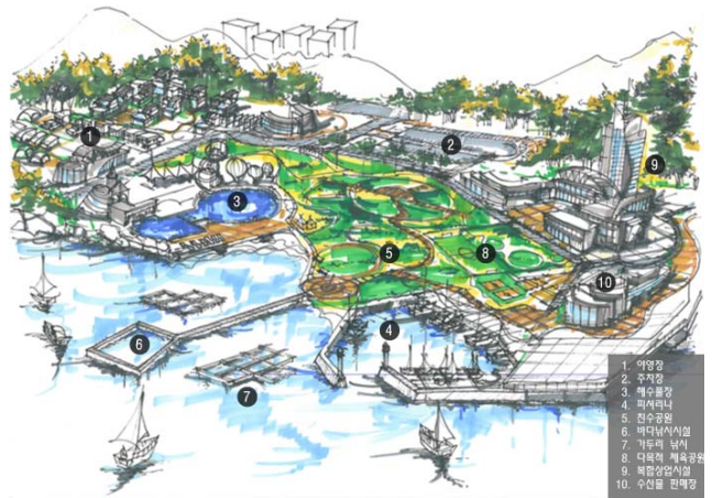
Fig. 7 Fishing complex village Model I