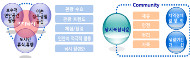
Fig. 2 Concept of fishing complex village

1) 개념: 낚시복합타운은 낚시전문인 뿐 아니라 가족단위의 관광객들이 낚시를 중심으로 다양한 레저 및 휴양을 즐길 수 있도록 어촌에 조성된 테마형 커뮤니티…… (중략) …….