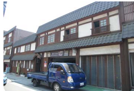
Fig. 2 Incheon Culture and History Street

인천 역사문화 거리는 인천항 배후에 위치한 개항기 근대 건축물들을 중심으로 지역의 역사와 문화를 재조명하고 역사의 현장을 보수, 복원하여 …… (중략) …….