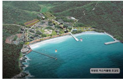
Fig. 12 Mater Plan