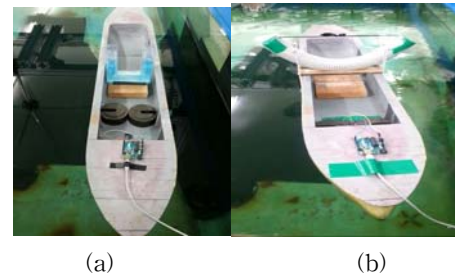
Picture 1 The model ship with anti-rolling tank and anti-rolling pendulum

Picture 1(a)는 안티롤링 탱크를 장착한 모델의 사진이고, Picture 1(b)는 안티롤링 추를 장착한 모델의 사진이고 Fig. 2는 실험 결과를 보인다.