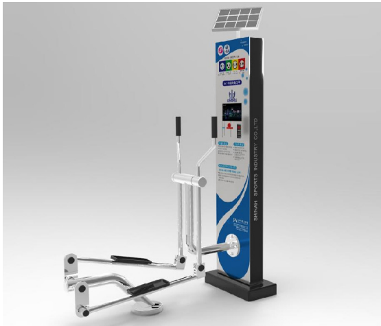
(그림 2) IT 융합형 야외체육기구 구현 예상도

IT 융합형 스마트 야외체육기구의 주요 기능은 다음과 같고, 구현 예상 모습은 그림 2와 같다.