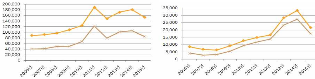
<표 2> 한국전체 및 금산군 인삼제품 수출곡선(해외전체와 중화권 수출액 비교)