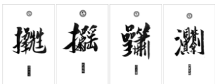
▶▶ 그림 4. 전갱(钱赓)의 “합체자(合体字)” 디자인

베이징의 유명 디자이너 전갱(钱赓)은 암팔선을 요소로 ‘합체자(合体字)’를 디자인하였는데 암팔선(暗八仙)을 한자의 형식으로 쓰기, 해체, 재조합의 과정을 통해 독특한 시각의 암팔선 요소를 나타냈으며 팔선신화, 도교 문화, 한자 서예를 유기적으로 결합하고 있다.