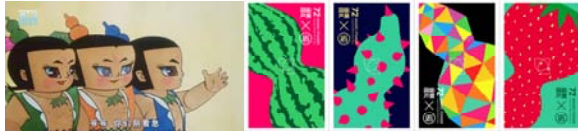
▶▶ 그림 2. 후루 형제 캐스트 및 후루 에너지 포스터

그 중 후루(葫芦 호리병박)는 “푸루(福祿, 복되고 영화로운 삶)와 발음이 비슷하여 광범위하게 응용되는 시각적 요소가 되었다. 애니메이션 캐스트 ‘후루(葫芦) 형제’는 이를 응용한 대표적인 작품 중 하나이다. 7명의 호리병박에서 출생한 남자아이들은 모두 신통력을 가지고 있는데 빨강, 주황, 노랑, 초록, 파랑, 남색, 보라색의 7가지 색깔로 구분된다. 머리에는 호리병 장식을 쓰고 신화 모험의 여정을 펼친다. 애니메이션 ‘후루(葫芦) 형제’는 80년대 방영하기 시작하여 한 세대에 영향을 미친 대표적인 애니메이션 작품이다.