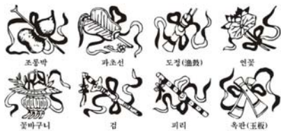
▶▶ 그림 3. 암팔선(暗八仙)의 시각요소

시각 디자인 영역에서 중국 유명 디자이너 류영광(刘永光)의 ‘후루(葫芦) 에너지’라는 브랜드 이미지 포스터 시리즈가 호리병 이미지를 디자인 모델로 하고 있어 그 변화의 특징을 인상적으로 충분히 잘 표현하고 있다. 팔선은 민간의 아름다운 소망의 집합체로서, 중국 민간의 집체성 사상을 설명한다. 팔선은 각자 한 가지 보물을 들고 있는데, 이는 팔선문화의 전형적인 시각원소로서, 민간에서 ‘암팔선(暗八仙)’ 즉, 팔선의 상징기호라 부른다. 또한 동시에 숫자 8도 팔선 문화에서 매우 중요한 의미를 가지며, 팔선은 8개의 같지 않은 인생을 상징한다.