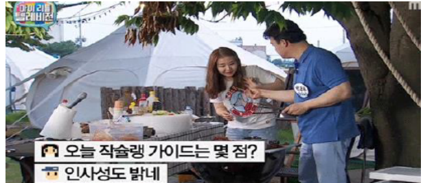
▶▶ 그림 4. 마이리틀텔레비전 방송 화면

마이리틀텔레비전은 그 동안의 소수 마니아의 전유물이었던 1인 미디어 인터넷 방송이 더 이상 소수의 마니아들의 전유물이 아닌 대중의 공감을 이끌어 내는 대중화에 큰 역할을 하고 있다.