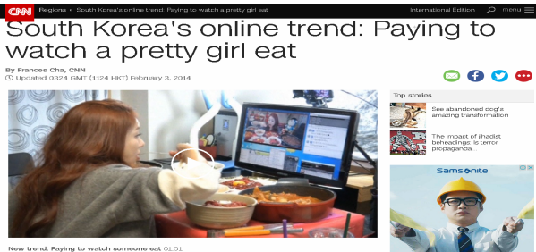
▶▶ 그림 3. CNN 보도

첫 번째 먹방은 CNN에 소개가 될 정도로 독특한 방송 트렌드가 되었다.