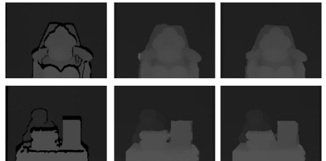
(a) JBU (b) 스테레오 정합 (c) 제안 방법

제안하는 방법을 평가하기 위해서 우리는 스테레오 기반 방식, 깊이 업샘플링 방법과 제안하는 방법을 비교하였다. 영상은 1280 \times 960 의 해상도를 갖는다. 깊이 카메라는 176 \times 960 의 해상도를 갖는다. 그림 3 은 기존 방법과 제안하는 방법의 결과를 보여준다. JBU 결과는 경계 영역에서는 좋은 결과를 얻지 못하지만 변위의 세밀함을 얻을 수 있다. 반면에 스테레오 기반 방식은 평탄한 영역에서 특히 변위의 정확성 및 세밀함이 떨어지는 경향이 있다. 실험 결과로부터 제안하는 방법의 결과가 세밀한 깊이를 가지면서도 정확한 경계 영역 획득함을 알 수 있다.