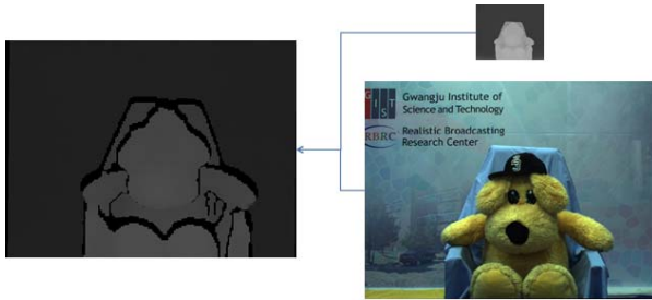
그림 2. 결합형 양방향 업샘플링 과정

제안하는 방법은 전역 스테레오 정합 방법에 기반한다 [2]. 깊이 카메라의 정보는 전역 에너지 함수의 요소로써 포함된다. 깊이 카메라 처리는 다음과 같다: 1) 깊이 정보가 3 차원 워핑을 통해서 스테레오 위치로 투영된다. 2) 깊이-변위 매핑이 실시된다 [3]. 이는 장면의 실제 범위가 깊이와 변위 사이에서 차이가 나기 때문에 진행된다. 3) 결합형 양방향 업샘플링(Joint bilateral upsampling, JBU)을 수행한다. 이 방법은 깊이 해상도의 해상도를 높이기 위해서 고해상도 색상 영상과 저해상도의 깊이 영상이 사용된다. 그림 2 는 깊이 카메라 정보를 3 차원 워핑한 후 결합형 양방향 필터를 적용한 결과를 보여준다.