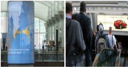
그림 1. 공항 디지털 사이니지

본 시스템과 동일한 분야의 사업모델은 없으나 유사한 디지털사이니지(DS) 제품은 소개되고 있다. 디지털사이니지는 네트워크를 통해 원격제어가 가능한 디지털 디스플레이를 공공장소 또는 상업공간에 설치하여 각종 정보, 엔터테인먼트, 광고 등을 제공하는 디지털 미디어로 각 요소들의 기술로는 콘텐츠 포맷기술, 콘텐츠 관리 기술, 콘텐츠 전송 및 분배 기술, 단말기에 대한 기술로 크게 분류가 되고 있다.