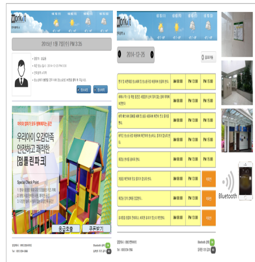
그림 3 시스템 전체 구성도 화면

그림 2는 디지털 사이니지 구성도를 나타낸 것이다. 기본 구성은 콘텐츠, 소프트웨어 솔루션, 네트워크, 디스플레이 장치 등으로 구성된다. 각 콘텐츠는 소프트웨어 솔루션을 이용하여 각 디스플레이 장치 및 웹서버에 제공된다. 웹 서버의 정보는 각 디스플레이에서 요청하는 정보를 전송하며 역으로 디스플레이에서 제공되는 정보를 수집 가능하다.