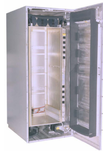
그림 1. Mission Critical Enclosure(MCE)

Baseline 7 이후부터는 MCE(Mission Critical Enclosure)라는, 장비를 보호하는 체계가 도입됨으로써 완벽한 COTS를 적용할 수 있게 되었다. MCE는 COTS 장비를 별도의 개조작업 없이 그대로 설치하여 운용할 수 있도록 제작된 장비 저장 및 운용 장치로, 내부에 설치된 장비를 외부 환경으로부터 보호하고, 전원공급이나 냉각 등을 제공하는 일종의 장비 랙(Rack)이다. 어떠한 종류의 상용 장비라도 그대로 설치가 가능하기 때문에 완벽한 COTS 적용이 가능하게 된 것이다. MCE의 형태는 그림 1과 같다[5].