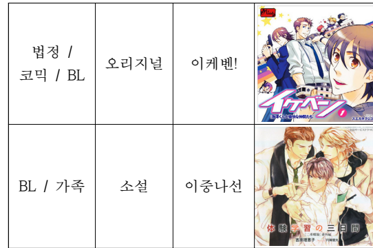
표 1. 원작과 장르가 드라마 CD

2) 드라마 CD에서 애니메이션화, 게임화 등의 다양한 사업으로의 연계 및 발전으로 수익을 창출할 수 있다. 대표적인 작품으로 honeybee에서 제작한 드라마 CD 성좌그이 시리즈인 <Starry☆Sky> (첫발매일 : 2009년 1월 30일)가 있다. 12성좌를 모티브로 총 12명의 캐릭터가 나오며, 데이트 시리즈, 성좌남편 시리즈, 낭만밭 시리즈, 계절 시리즈, OST 시리즈, 필름 페스티벌 시리즈 등이 발매되었다. 또한 드라마 CD의 성공에 힘입어 게임화(2009년 3월 27일 발매), 만화화(2009년 10월 발매), 그리고 애니메이션화(2010년 12월~2011년 06월 방영)등 여러 미디어믹스로 연결하여 2009년 이후부터 2012년의 사이에 여성향 관련 매체 시장을 대표하는 작품 중 하나로 꼽힌다 1) . 또한 다른 작품으로는 2005년 발매된 <Are you Alice?>등 일본의 경우 드라마 CD와 다른 미디어와의 미디어믹스는 쉽게 찾아볼 수 있다.