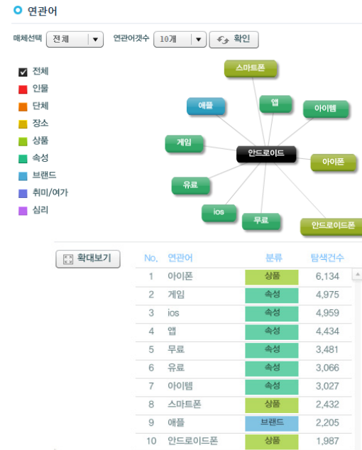
그림 2. 안드로이드 탐색 연관어 빈도(2015년 9월)

2015년 8월 대중들의 안드로이드에 대한 전체 탐색어는 그림 1에서와 같이 아이폰과 앱 그리고 스마트폰의 기능과 관련하여 생각하는 것을 확인할 수 있었다. 그런데 2015년 9월 대중들의 1달 기간인데도 불구하고 아이폰과 게임 기능을 연관 지어서 생각하고 있는 것을 확인할 수 있다. 아마도 이 기간에 새로운 게임이 출시가 이러한 변화를 설명해 줄 수 있겠다. 다음으로 특이한 변화는 표 2에서 나타나 있는 것과 같이 연관어 순위 10위에 안드로이드폰이 등장함을 알 수 있다. 이러한 결과는 언론을 통해 구글에서 스마트폰 단말기에 대한 관심과 단말기 출시를 암시하는 보도가 결과로 나타난 것으로 유추된다. 다음으로 키워드 안드로이드에 대한 연관어 아이폰 검색어 빈도수 8,278에서 6,134로 줄어 들은 것을 확인할 수 있다. 이러한 변화는 무엇을 의미하는 것인지가 우리들의 관심사가 아닐지 질문을 던지고 싶다. 최근 빅 데이터의 중요성은 다양한 종류의 데이터를 실시간으로 분석함으로써 객관적이고 올바른 의사결정이 가능하도록 하는데 많은 도움이 될 뿐만 아니라 일정한 흐름을 포착해 미래의 예측이 가능하다는데 있다고 말할 수 있다. 아직도 초기 단계에 머물고 있는 빅 데이터에 대한 연구는 다양한 방법으로 진행될 것으로 판단된다.