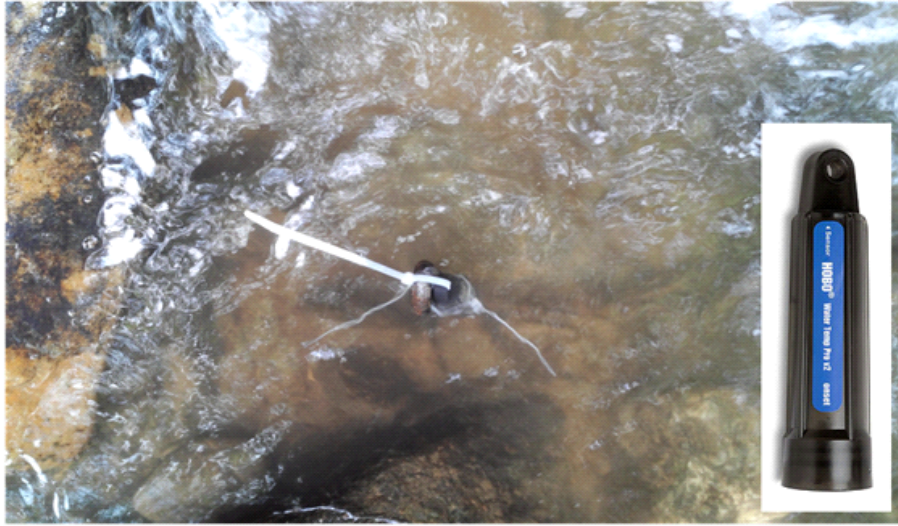
Fig. 2. Photos of the water temperature sensor installation at point 1.