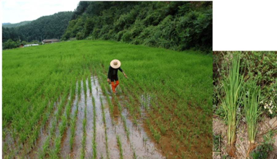
Fig. 4. Rice growth conditions at the paddy field damaged by cold water.

민원 발생 현지 논외 벼 생육상황을 관찰한 결과, 피해를 받지 않는 벼는 영화분화 중기로 이삭길이가 15~35mm이었으나, 피해 벼는 아직도 이삭이 생기지 않았으며, 포기당 분얼수와 초장이 정상 벼의 1/3 수준으로 조사되었다. 이러한 현상은 농업용수 유입구와 가까울수록 심한 경향을 나타내었다(Fig. 4).