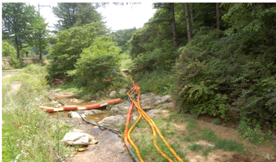
Fig. 3. Photo of plastic tube irrigation for water temperature rise.

민원이 발생한 냉수피해 논은 곡간지 계단식 논으로 골프장 조성 전에는 인근 계곡물을 약 200m 비닐튜브로 연결하여 농업용수로 이용하였으나, 골프장 조성 후에는 1.5km 길이의 지하배수관(3~10m 깊이)에서 흘러나오는 물을 약 200m 비닐튜브로 연결하여 벼논에 관개하고 있었다 (Fig. 3).