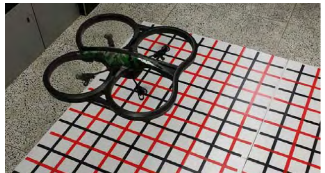
(그림 1) AR.Drone 2.0을 이용한 오차 측정 환경

부착된 가속도 센서로 이동량을 추정한다. 첫 번째 단계에서 기록한 이동량과 이동 속도의 쌍으로 추정한 이동량에 대응되는 이동 속도를 획득한다. 그리고 움직임 시간 차 \Delta t 를 이동 속도에 곱해서 호버링 오차를 계산한다.